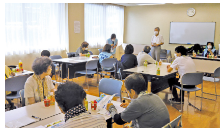
スポットでの交流会の様子