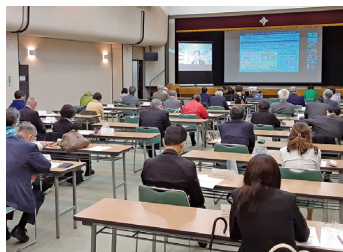
会場参加とオンライン参加を併用した研修会