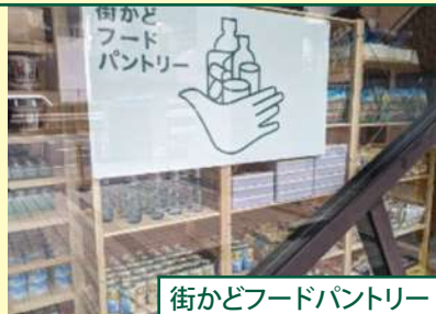
街かどフードパントリー