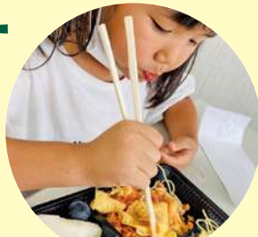
みんなの食堂フラワー

※そのほか、物品・食品の運搬、食品等の保管場所の提供、企業で取り扱う物品・グッズ等の提供、生理用品等の提供にご協力をお願いいたします。 ※ご提供いただく食品等には、賞味期限などの条件があります。詳しくはお問い合わせください。