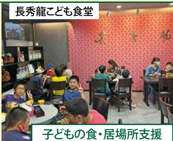
子どもの食・居場所支援