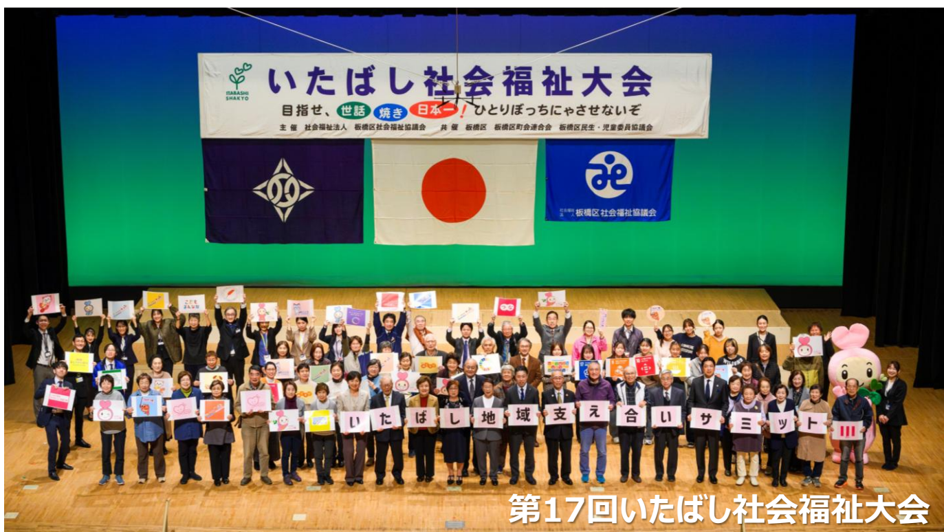
第17回いたばし社会福祉大会

いたばし社協では、区民や地域活動者、福祉関係者等が一堂に会し、日頃の活動への誠意と優れた福祉活動の紹介を行うことを通して、誰もが支え合いながら安心して暮らすことができる「ともに生きる豊かな地域社会」づくりをめざし、板橋区と板橋区町会連合会、板橋区民生・児童委員協議会の共催を得て「いたばし社会福祉大会」を年1回開催しています。